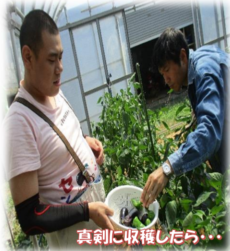
真剣に収穫したら・・・