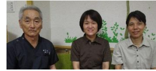
担当の 理学療法士・歯科衛生士

理学療法士・歯科衛生士がプログラムを計画し、ご本人らしく生活できる時間を維持するための身体を動かした健康づくりをしています