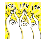
『流れ星』賞 鵜の浜・月岡 ユニット