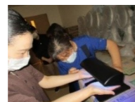
洗い残しの確認中