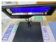
ブラックライト登場