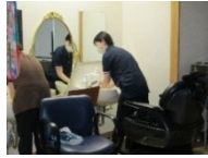
普段通りの手洗いをします

普段通りに手を洗い、ブラックライトを当てて洗い残しのある部分を目で見て確認。 自分の手洗いの弱点を理解し、意識向上につながる研修となりました。