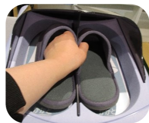
履き終わったスリッパを上にとくと自動的に回収されます