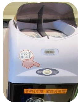
ボタンを押すとスリッパが出ます

なお、館内では引き続き感染症対策中です。マスク着用の上、入口にて『検温・手洗い・うがい』のご協力をお願いしております。何事も困難な時期ではありますが、皆様のご協力お願い申し上げます。